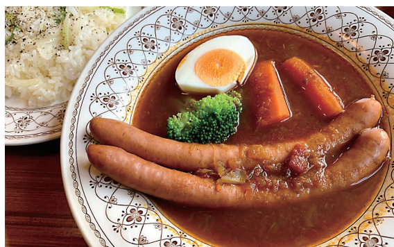
スープカレー(ウインナー) ハンバーグと合わせて一日限定5食

※スープカレー(ウインナー及びハンバーグ)は合わせて一日限定5食となります。 ※事前予約のみ。 ※前日夕方4時までにご注文お願いいたします。