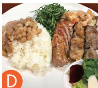
ミックスグリルランチ