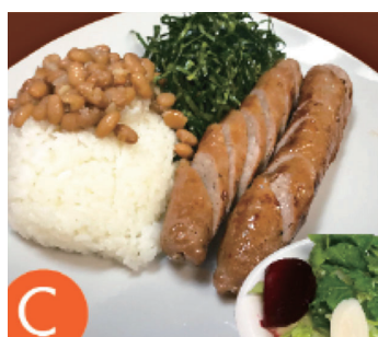
豚ソーセージランチ