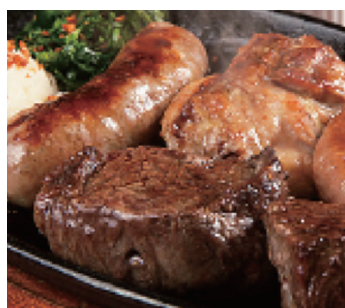
ミックスシュラスコ

※決済方法：現金・PayPay ※メニュー表にあるものはすべてテイクアウトOK ※火曜~木曜以外：[金] 11:30~14:00 18:00~23:00 [土] 18:00~23:00 [日] 18:00~22:00